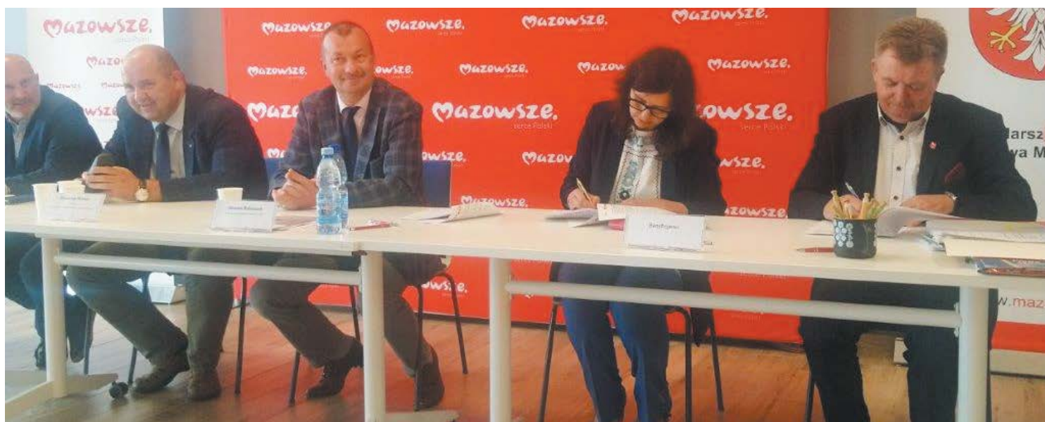
W dniu 30.06.2021 w Piasecznie miało miejsce uroczyste podpisanie umów z przedstawicielami Zarządu Województwa Mazowieckiego.

Ponadto Gmina otrzymała środki z Urzędu Marszałkowskiego na dofinansowanie zakupu nowego lekkiego specjalnego samochodu ratownictwa technicznego z funkcją gaśniczą z przeznaczeniem na wyposażenie OSP w Baranowie w kwocie 80 000 PLN oraz na modernizację budynku użytkowanego przez jednostkę OSP w Osinach w wysokości 22 000 PLN.